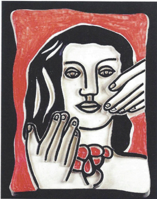
Fernand Léger, 1949, Visage aux deux mains sur fond rouge , 46x33 cm.