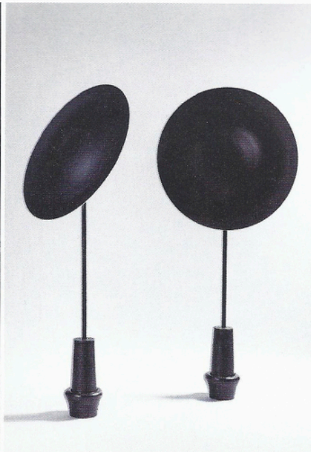
Éric Schmitt, lampe Sugegasa, 2013, hauteur : 175 cm, diamètre : 80 cm.