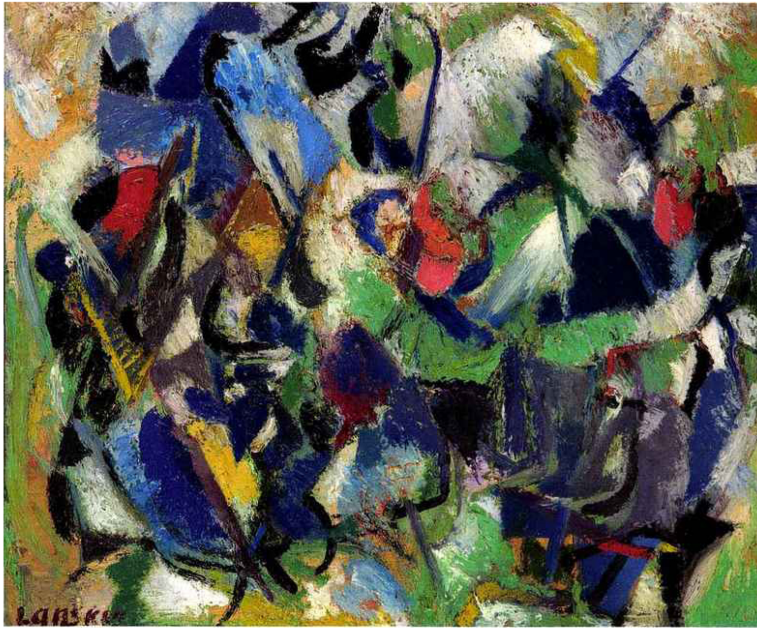
Andre Lansky, Aspect de la vérité , 1952, huile sur toile, 54 x 65 cm.