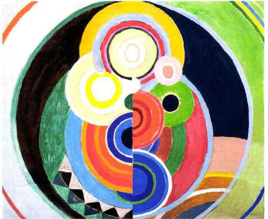
À gauche, Mao Yan, Goya Impression , 2010, pinceau et aquarelle sur papier, 61 x 46 cm.