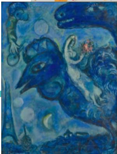
Marc Chagall, Le Coq bleu , 1960, huile et sciures sur Pavetex, 70 x 54 cm GALERIE TAMÉNAGA, PARIS.