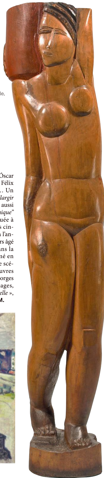
À droite Ossip Zadkine, Jeune Fille à la cruche , 1920, bois, H. 199 cm HÉLÈNE BAILLY GALLERY, PARIS.