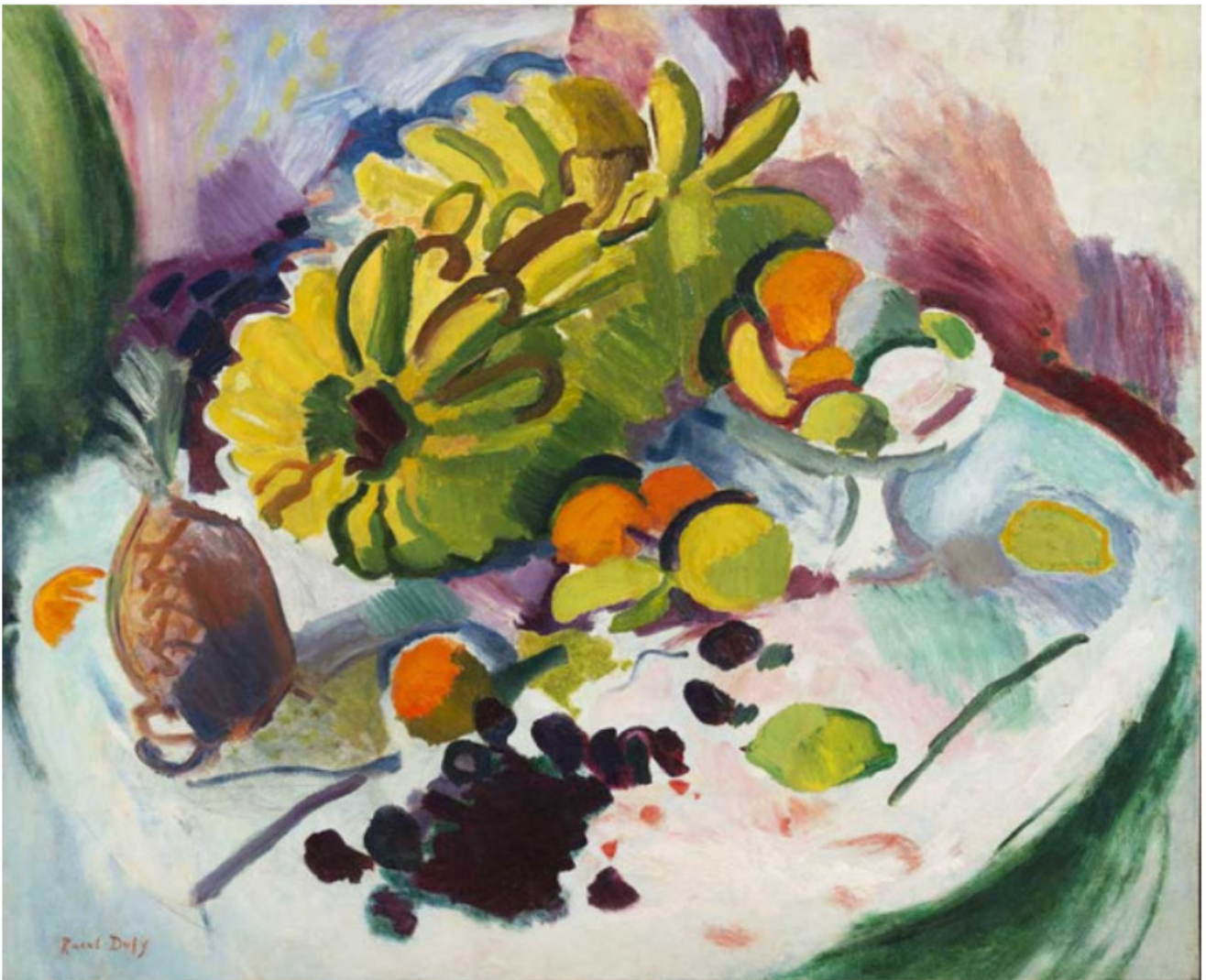
Raoul Dufy, Compotier, bananes et fruits sur un entablement , 1905, huile sur toile, 81 x 95 cm, Courtesy Hélène Bailly

Cette fois-ci, un immense Arbre à cocons imaginé par Charles Macaire baigne le premier espace de la galerie d'une ambiance apaisante et printanière. Ce luminaire sculptural, entièrement réalisé en papier, fait écho au Paysage avec arbres d'Othon Friesz, un tableau de 1907 aux tonalités automnales, caractéristique de sa période fauve. De part et d'autre de cette toile figurent Les Roses rouges de Cuno Amiet – grand peintre suisse méconnu – et Compotier, bananes et fruits sur entablement de Raoul Dufy , une composition du début des années 1900.