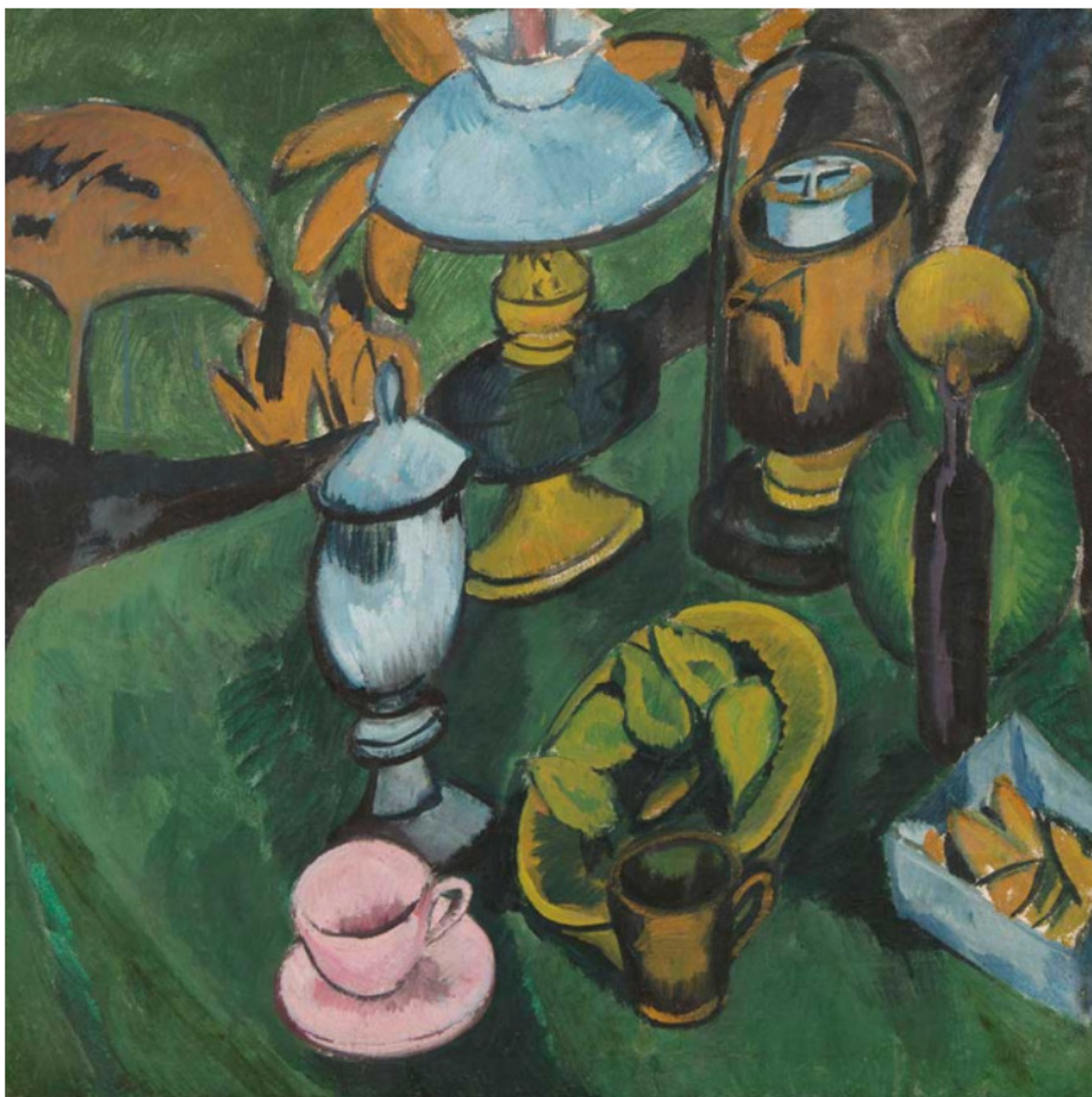
Ernst Ludwig Kirchner, Nature morte à la lampe , 1912, huile sur toile et châssis d'origine, 95 x 95 cm

Aux côtés de ces pièces monumentales qui opèrent un lien avec « Up in the air », la précédente exposition de la galerie Hélène Bailly autour du ciel et de ses représentations, le visiteur découvrira d'autres approches de la couleur. Cofondateur du groupe ZERO, l'Allemand Otto Piene illumine l'espace d'un Soleil rouge (2003) aux frontières de l'abstraction. Dans sa Nature morte à la lampe (1912), Ernst Ludwig Kirchner – figure du groupe Die Brücke et maître de l'expressionnisme allemand –, déconstruit l'espace. Chez lui, la couleur crée le modelé, donne vie aux objets. Le camaïeu de vert qui domine sa composition est réveillé par des touches d'orange et de rose (la tasse du premier plan).