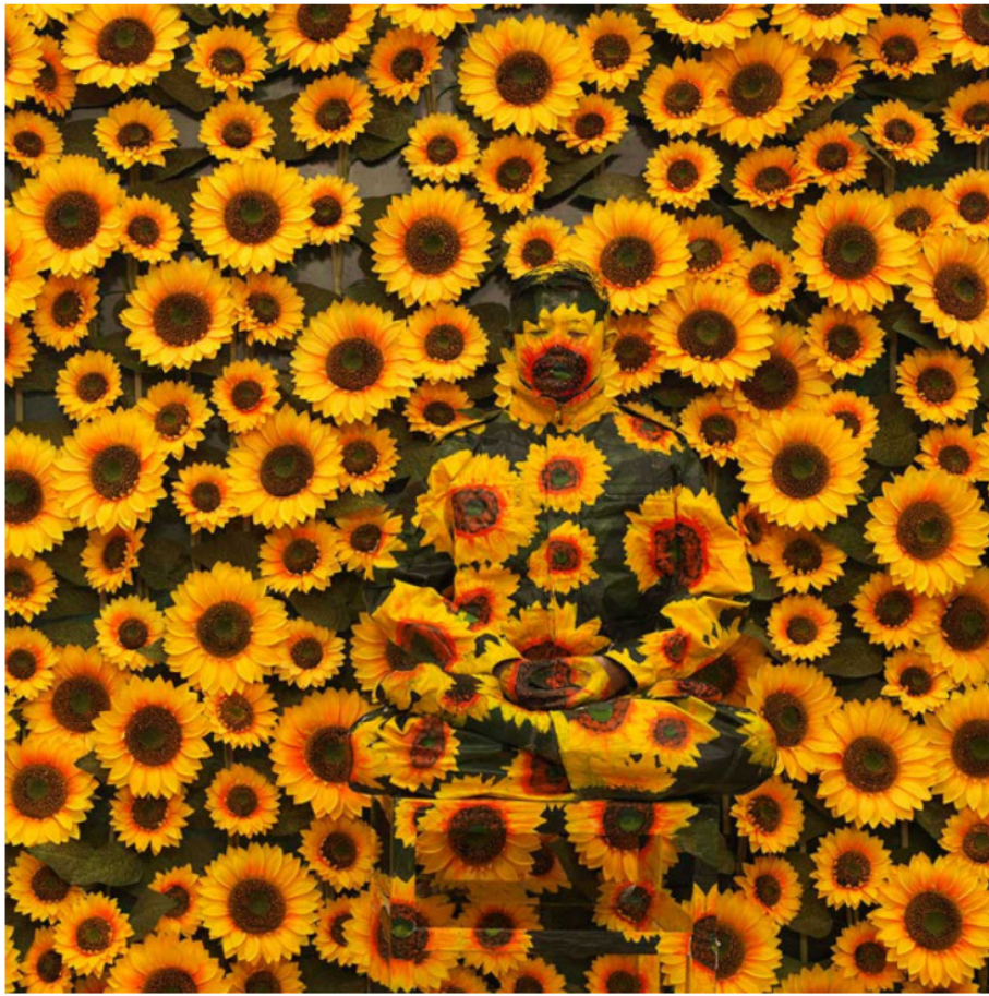
Liu Bolin, Sunflowers, photographie, numérotée 1/6, 120 x 120 cm

Véritable hymne à la couleur, l'exposition occupe tout le rez-de-chaussée (le sous-sol étant dédié à d'autres artistes de la galerie). Au fil des semaines, l'accrochage de « Colorama » est susceptible d'évoluer, avec de nouvelles surprises à découvrir. N'hésitez pas à revenir !