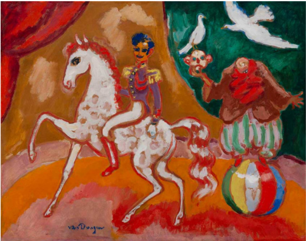
Kees van Dongen, Le Cirque , circa 1950, huile, gouache et crayon sur papier contrecollé sur carton, 50,5 x 61,1 cm, Courtesy Hélène Bailly

Depuis la précédente exposition, la galerie Hélène Bailly s'est offert une petite cure de jouvence. En témoignent la façade, repeinte d'un blanc immaculé, les vitrines équipées de cimaises transparentes (où sont présentés une huile de Maurice Estève et un extraordinaire Tondo de Jean-Paul Riopelle) et le relooking de l'étroit couloir qui mène à la pièce du fond. Le nouveau revêtement du mur et les miroirs qui couvrent le plafond agrandissent l'espace. L'accrochage est désormais minimaliste, avec un seul tableau présenté, une œuvre d'Alexander Calder datée de 1969 qui permet d'introduire la deuxième salle de l'exposition, articulée autour des couleurs primaires.