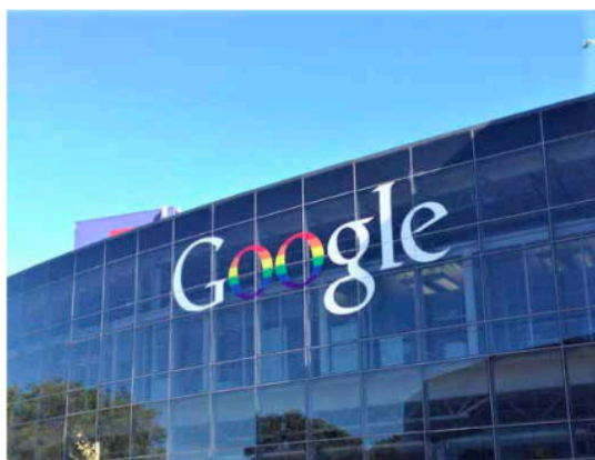
Les deux organismes français de droits d'auteur ont signé un accord avec Google.