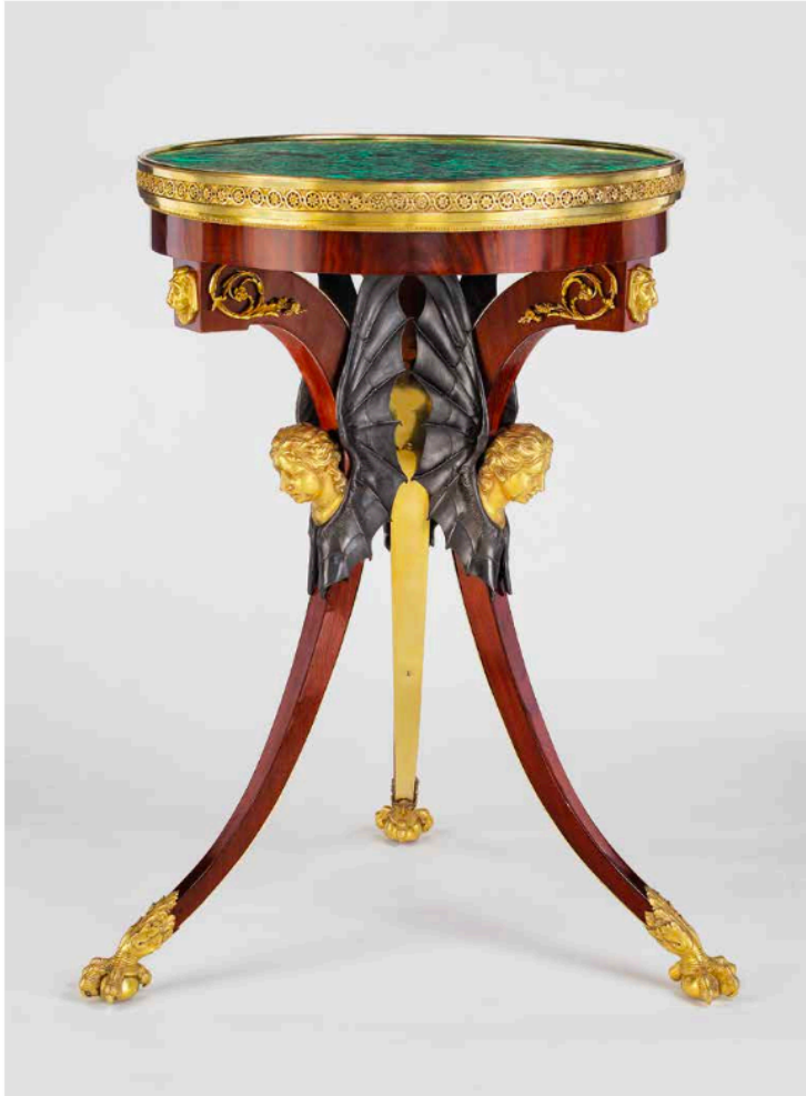
Guéridon impérial russe présenté par la galerie Neuse, Brême.