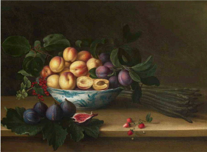
Louyse Moillon, Nature morte aux figes, asperges, prunes et abricots dans une coupe en faïence bleue, Galerie Coatelem, Paris.

Le Syndicat national des antiquaires et Christie's ont dévoilé hier les contours de la vente aux enchères qui doit remplacer, cet automne, la Biennale Paris, reportée à 2021 en raison de la crise sanitaire. C'est bien de contours qu'il s'agit en l'espèce : difficile pour l'heure de se faire une idée précise de ce que ce projet inédit offrira. D'abord parce que ce dernier est encore un work in progress . Mais aussi parce que, initialement prévue en septembre, mois habituel de la Biennale Paris, la vente a été décalée à la première quinzaine d'automne, « pour bénéficier d'une plus forte exposition publique et médiatique », ceci expliquant sans doute cela.