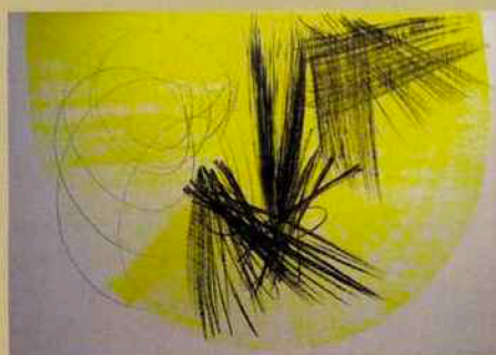
Hans Hartung, P40- 1975-H43, 1975, acrylique sur carton, 75 x 104,6 cm, galerie Boulakia.