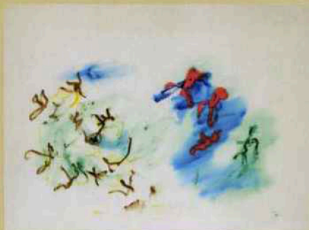
Henri Michaux, Sans titre, 1962, gouache sur papier, 49 x 63 cm, galerie AB.