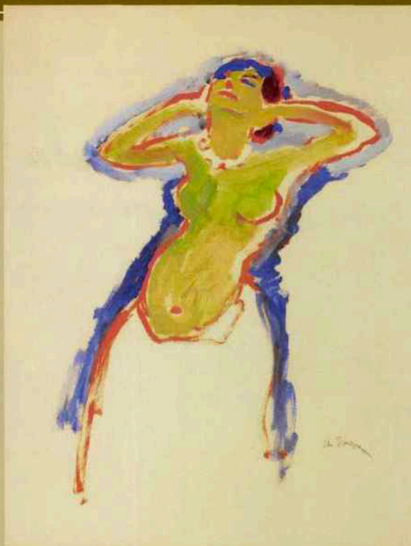
Kees Van Dongen, Danseuse, huile sur papier, support carton, 64 x 49,2 cm, Helene Bailly Gallery.

car celle-ci est révélatrice de la santé et de l'attractivité de notre manifestation. Avec seize nouveaux noms, nous demeurons dans la moyenne des éditions antérieures et c'est, de mon point de vue, un pourcentage idéal. Cela signifie que nous sommes en mesure d'apporter de la nouveauté sans toutefois remettre en cause les équilibres internes entre les diverses spécialités, sans bousculer tout l'ensemble. Je pense qu'il est important que nous puissions offrir à nos visiteurs une forme de continuité, avec des galeries fidèles à l'événement depuis de très longues années et que nos visiteurs aiment à retrouver, tout en offrant une touche de nouveauté. Car grâce à cela, notre événement conserve sa force et témoigne de son ouverture.